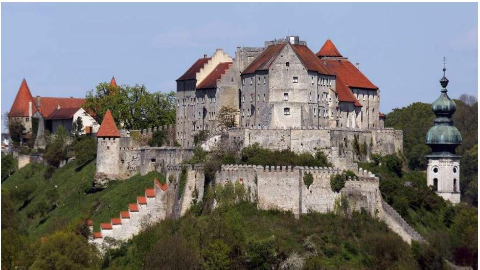
Die Hauptburg der 1.051 Meter langen Burghausen Burg.

Burghausen, eine Stadt in Oberbayern, an der Salzach gelegen nahe der Grenze zu Österreich, mit der größten Burganlage der Welt – immer eine Reise wert.